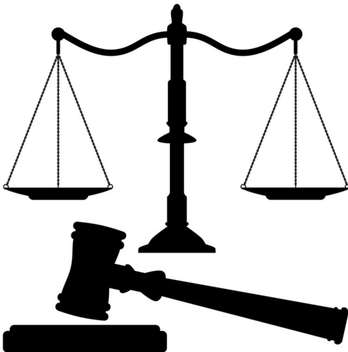
Imagem pública anônima

Nestes dias alguns jornalistas e membros das redes sociais manifestaram suas intenções favoráveis a uma intervenção das Forças Armadas para "endireitar" o Brasil.